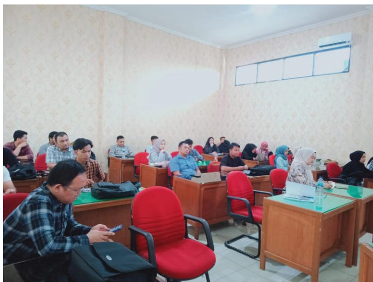
Gambar 3. Peserta Pelatihan Teknik Antiplagiarisme

Workshop dilakukan secara langsung atau daring dengan praktik langsung, sehingga mahasiswa dapat mencoba fitur-fitur Mendeley dan memahami penerapan teknik antiplagiarisme dalam penulisan karya ilmiah.