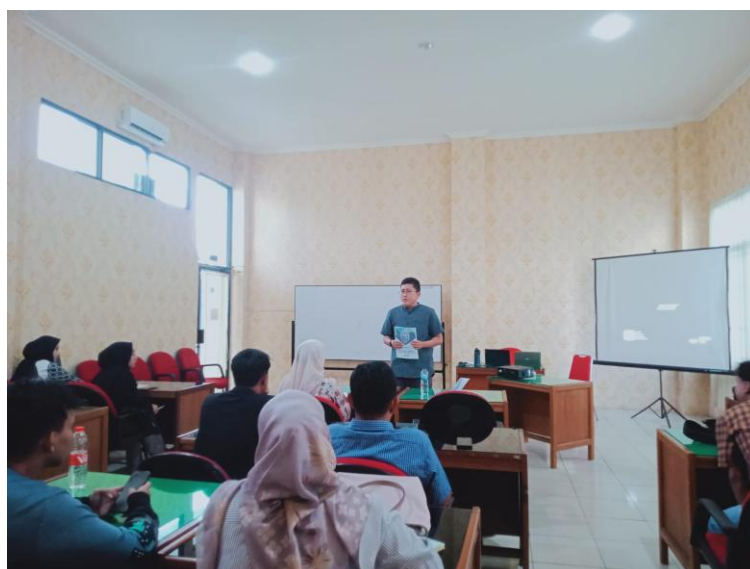
Gambar 2. Kegiatan Pelatihan Teknik Antiplagiarisme dan Penggunaan Aplikasi Mendeley

Penurunan tingkat plagiarisme dikalangan mahasiswa secara tidak langsung menjadi tanggung jawab moral bagi dosen, sehingga perlu dilakukan bentuk upaya untuk menurunkan tingkat plagiarisme di kalangan mahasiswa, sehingga dilaksanakanlah kegiatan pengabdian dalam bentuk “Pelatihan Teknik Anti Plagiarisme dan Penggunaan Mendeley di Kalangan mahasiswa Fakultas Ekonomi dan Bisnis Universitas Jambi.