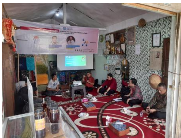
Gambar 2. Photo Kegiatan Pelaksanaan Kegiatan

Kegiatan Pengabdian Kepada Masyarakat (PKM) dengan tema “Pemanfaatan Shopee Affiliate sebagai Strategi Digitalisasi UMKM di Kampung Wisata Kampung Laut” dilaksanakan di Sanggar Saye Batik, Kampung Laut, Kecamatan Kuala Jambi. Kegiatan ini diikuti oleh sekitar 15 peserta yang terdiri dari anggota Pokdarwis, Karang Taruna, pelaku UMKM, masyarakat umum, serta anggota PKK. Seluruh peserta dipilih berdasarkan minat mereka terhadap pengembangan usaha dan kebutuhan peningkatan literasi digital.