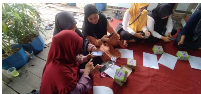
Gambar 3. Photo Penyampaian dan Praktek Peserta

Pelaksanaan kegiatan dimulai dengan tahap pembukaan yang diisi dengan sambutan dari perwakilan Universitas Dinamika Bangsa dan Ketua UMKM setempat. Setelah itu, kegiatan dilanjutkan dengan sesi pretest untuk mengetahui tingkat pemahaman awal peserta mengenai pemasaran digital dan pemanfaatan Shopee Affiliate. Hasil pretest menunjukkan bahwa sebagian besar peserta masih memiliki pemahaman terbatas mengenai strategi pemasaran berbasis teknologi.