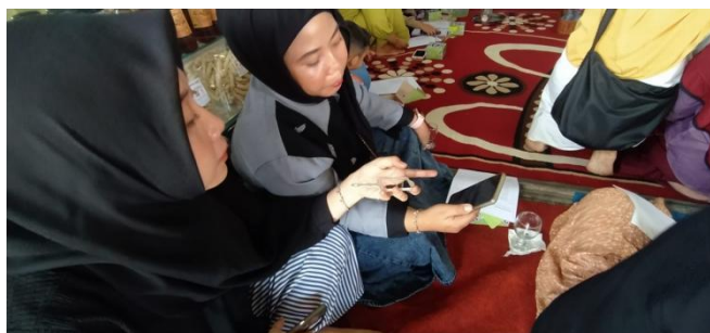
Gambar 4. Photo Pengisian Post-test Peserta

Pembahasan ini berfokus pada analisis efektivitas program Pengabdian kepada Masyarakat (PKM) yang bertema “Pemanfaatan Shopee Affiliate sebagai Strategi Digitalisasi UMKM di Kampung Wisata Kampung Laut” melalui perbandingan hasil pre-test/post-test serta umpan balik dari peserta